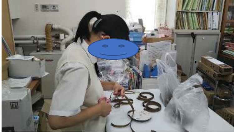
製菓店（チーズの梱包等）