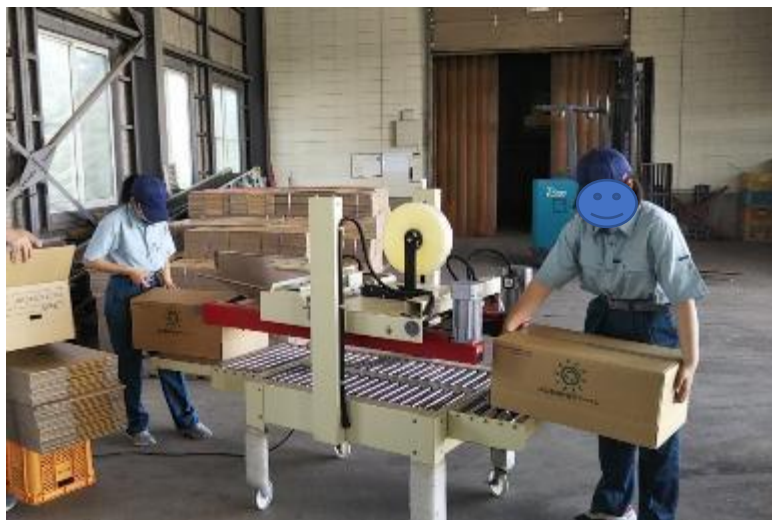
農家のダンボール作り