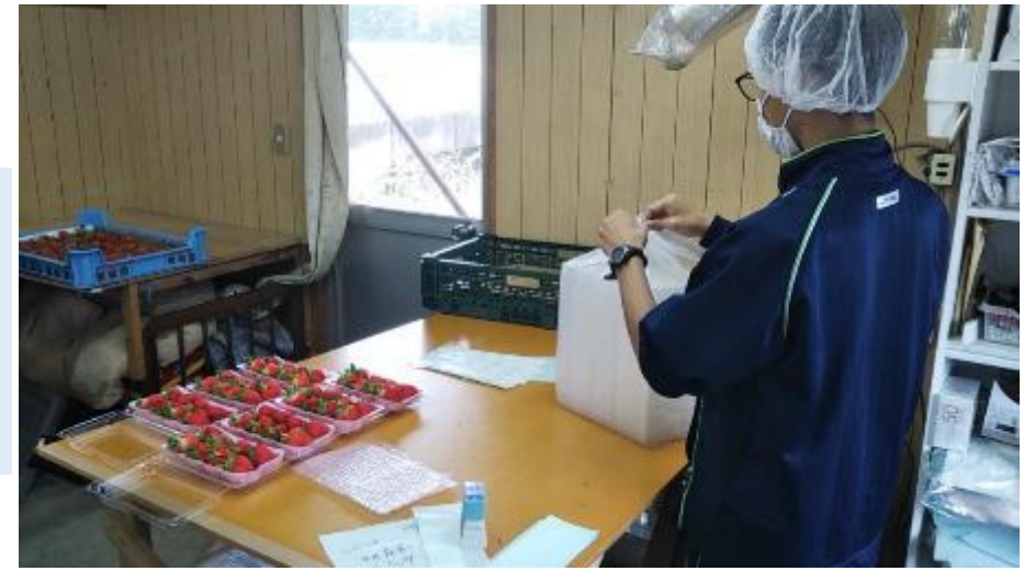
農場（イチゴのパック詰め）